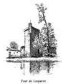
Tour de Lesparre